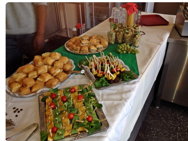
Produkte in der Schulcafeteria „Café Käthe“

Die Ausbildungsvorbereitung ermöglicht den Erwerb des Hauptschulabschlusses nach Klasse neun, wenn die entsprechenden Leistungen erzielt werden.