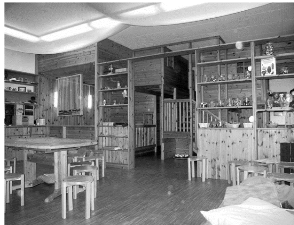
Blick in den Fachraum Sozialpädagogik

Die Berechtigung zum Besuch der gymnasialen Oberstufe wird erteilt, wenn in Deutsch/ Kommunikation, Englisch und Mathematik mindestens gute Leistungen oder wenn in diesen und drei weiteren Fächern mindestens befriedigende Leistungen erzielt werden. Ausreichende Leistungen in nicht mehr als einem der genannten Fächer können durch gute Leistungen in einem anderen dieser Fächer ausgeglichen werden.